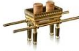
הַשֻּׁלְחָן לֶחֶם פָּנִים